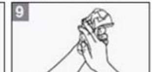
9 Droog uw handen met een propere handdoek of doekje