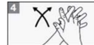
4 Was goed tussen de vingers