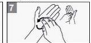
7 Was de vingertoppen pansen