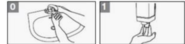
0 Maak uw handen nat met water