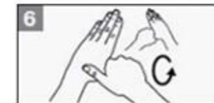
6 Was de duim van beide handen