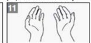
11 Uw handen zijn nu proper