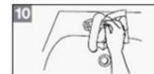
10 Draai de kraan dicht met het doekje