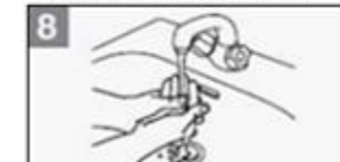
8 Spoel de handen goed af