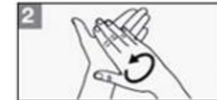
2 Wrijf uw handpalmen tegen elkaar