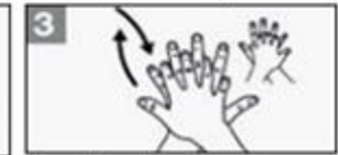
3 Was de handrug van beide handen